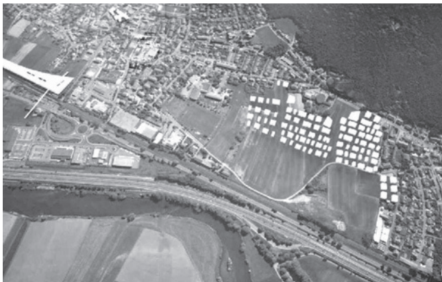
Bubenreuth 4.0 - 1. Entwürfe der TH

Bürgermeister, Gemeinderat und Ortsentwicklungsgruppe stellen vor!