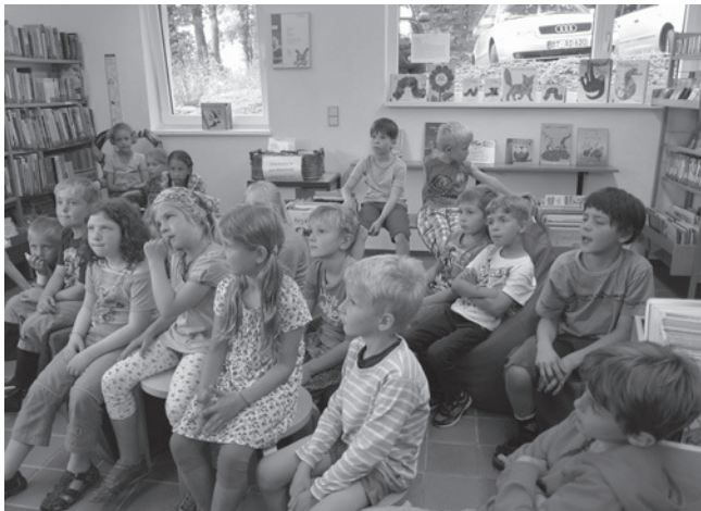
Aufmerksame Zuhörer beim Besuch zum Schuljahresabschluss in der Bücherei

Im letzten Schuljahr besuchten alle vier Grundschulklassen der Stufen 1/2 regelmäßig alle vier Wochen die Bücherei. Sie erfuhren, wie eine Bücherei funktioniert, dass man zum Ausleihen einen Leseausweis braucht, wie viele Bücher sich im Bestand befinden und dass jedes Buch seinen festen Platz im Regal hat.