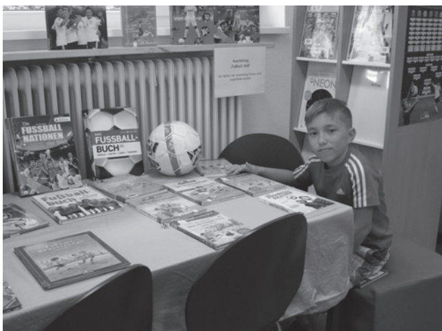
Buchausstellung und Vorlesestunde im Zeichen der Fußball-WM 2014

Aktuelle Veranstaltungshinweise und Informationen finden Sie auch immer auf der Homepage der Bücherei.